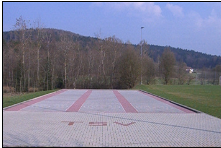
Blick auf die Stockbahnen des TSV Sattelpfeilstein

Die Stockabteilung ist die „jüngste“ Abteilung des TSV Sattelpfeilstein und wurde 2005 gegründet. Bereits ein Jahr später konnte man die neu gebaute Stockbahn (3 Bahnen) einweihen und in Betrieb nehmen.