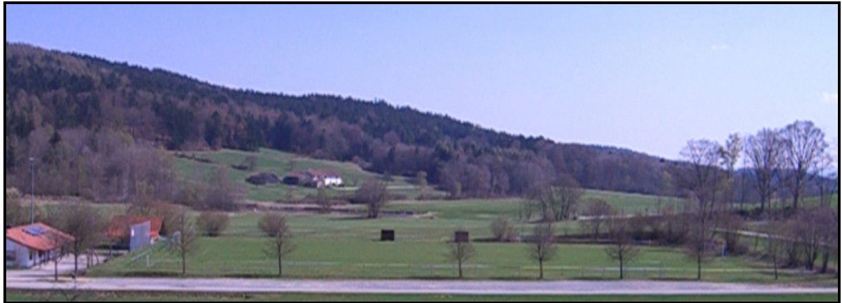
Blick auf den Hauptplatz des TSV Sattelpfeilstein

Die Bandenwerbung wird auf dem Hauptplatz des TSV Sattelpfeilstein installiert.