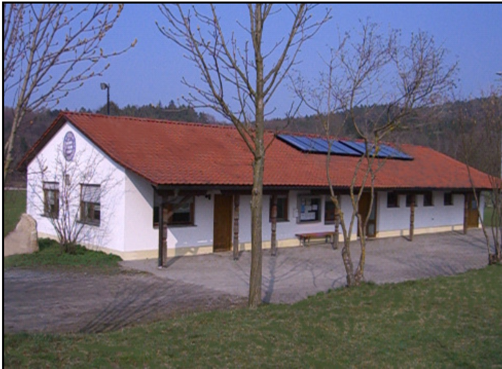
Blick vom Hauptplatz auf das Vereinsheim des TSV Sattelpelstein

Das Sportgelände befindet sich in Sattelpelstein, Köpfelsbergweg 26. Der Hauptplatz befindet sich vor dem Vereinsheim, ein Trainingsplatz und die Stockbahnen befinden sich dahinter.